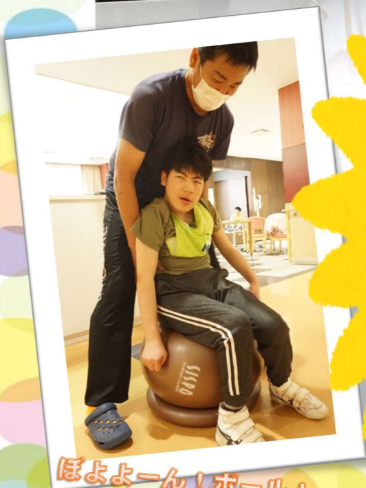
ぽよよーん! ボール!

週2回程、城本 PT に来て頂き、個別のリハビリテーションを実施しています。リハビリ希望の方に対し、それぞれの身体状況に応じて施術を行っています。歩行訓練、立ち上がり、立位・座位保持保持、緊張緩和のためのマッサージ等々。PT と共にみなさん一生懸命取り組んでいます!