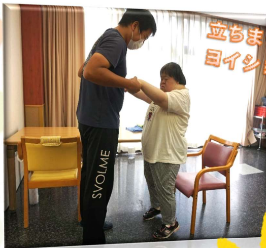
立ちまーす ヨイショ!